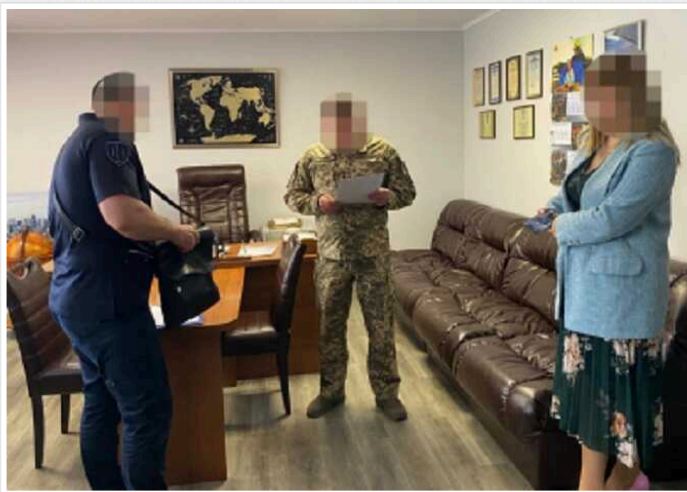
У Миколаєві військовий посадовець вкрав понад 10 мільйонів гривень на закупівлях для потреб оборони

Працівники ДБР повідомили про підозру начальнику Миколаївського квартирно-експлуатаційного управління. Він у змові з приватним підприємцем привласнив понад 10 млн грн, виділених на оборону.