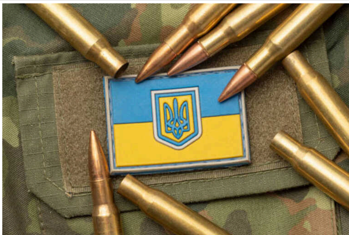
Хто забезпечує безпеку в агенції оборонних закупівель?