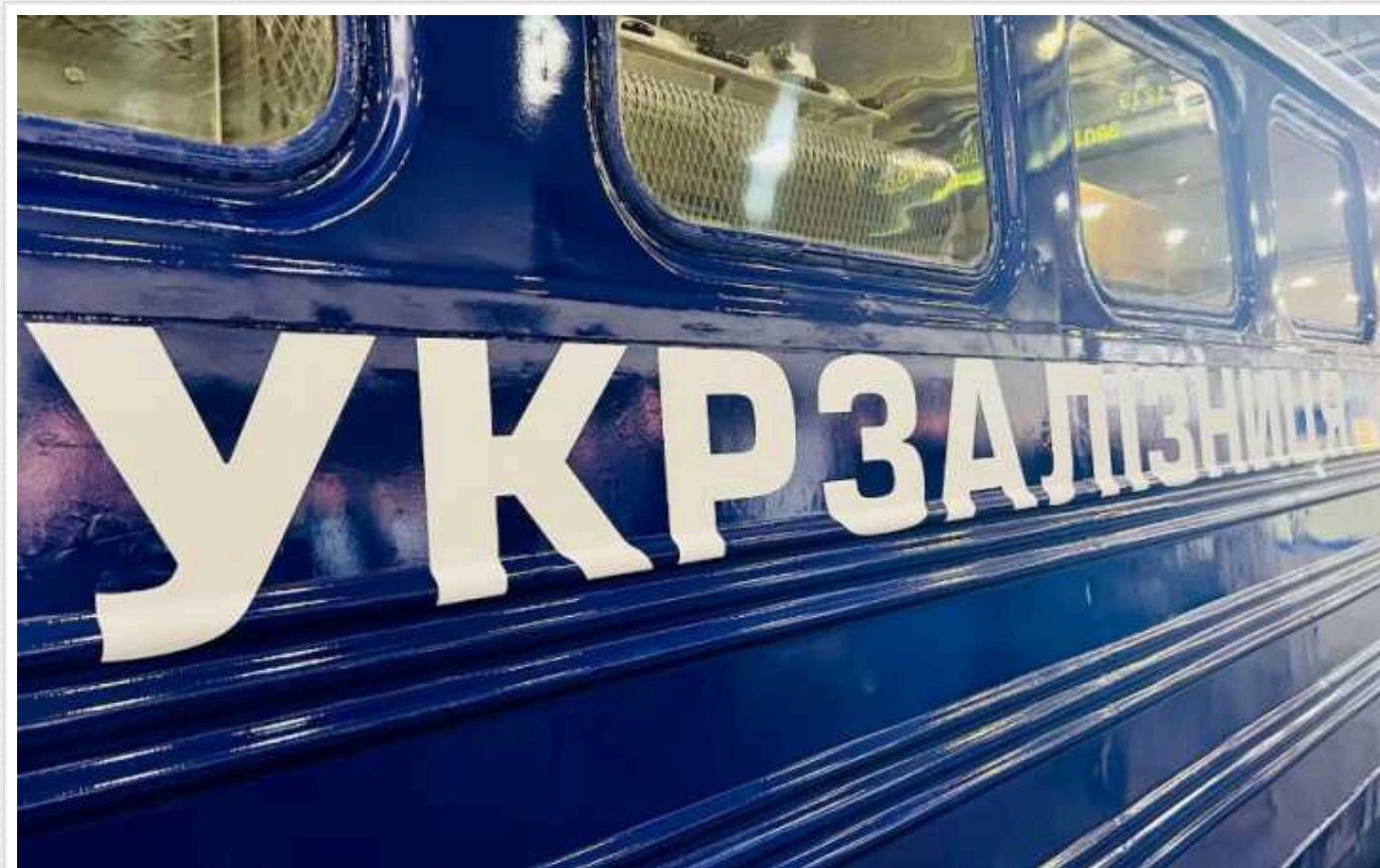
Троє ексдетективів НАБУ, які роками розслідували корупцію в "УЗ", після звільнення одразу влаштувалися працювати в цю держкомпанію

Крім того, один із них отримав акції підприємств, щодо яких НАБУ вело перевірку.