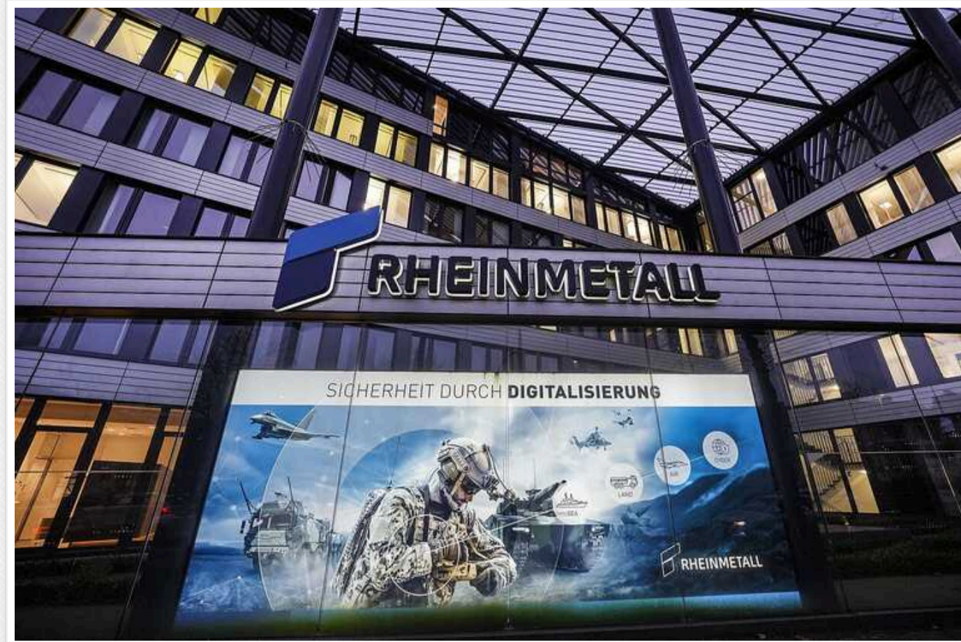
Rheinmetall отримав рекордне в історії замовлення на постачання 155-мм боєприпасів ціною до 8,5 мільярда євро

Торік у жовтні Die Welt повідомляло, що з початку війни в Україні ціни на такі снаряди виробництва Rheinmetall зросли в півтора рази – з 2 тис. євро до 3,6 тис. євро.