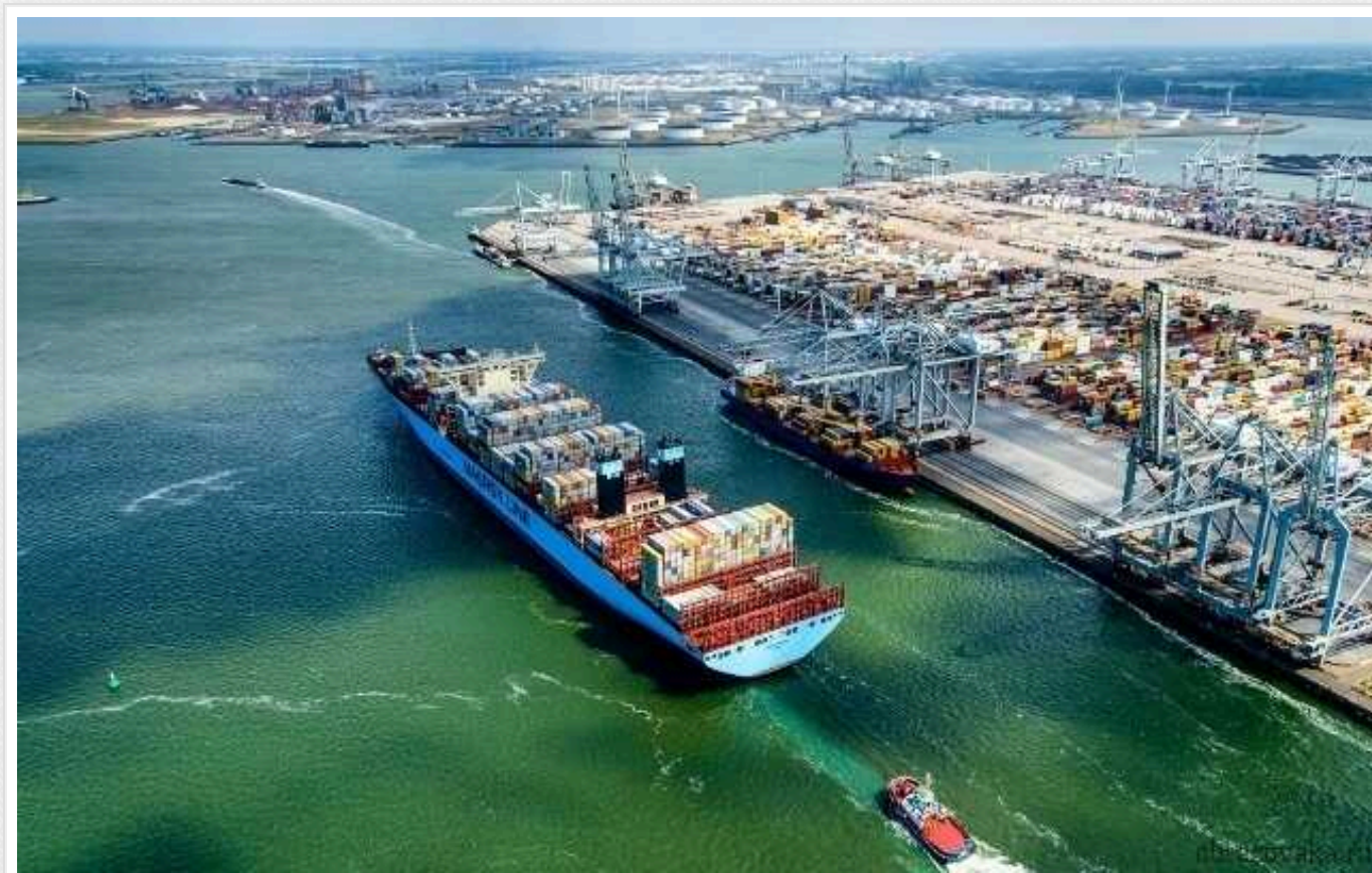
Нові санкції проти РФ закриють європейські порти для її тіньового флоту, - глава МЗС Нідерландів

Міністерка закордонних справ Нідерландів Ганке Бруїнс Слот заявила, що нові санкції Євросоюзу вдарять по нафтовому тіньовому флоту Росії.