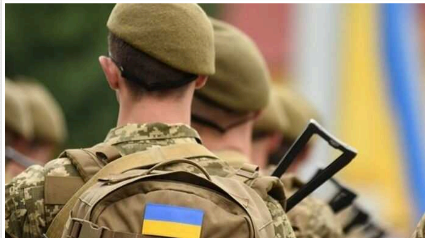
У Вінниці солдат викрав дві військові радіостанції вартістю 1,5 мільйони гривень

У Вінниці солдат викрав з військової частини дві радіостанції та запчастини вартістю 1,5 млн гривень.