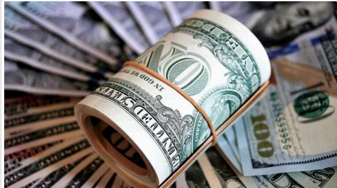
Російських грошей доведеться почекаати: 50 мільярдів доларів не врятують бюджет України просто зараз

Україна не отримає відсотки від заблокованих російських активів у 2024 році. За цей період у G7 буде лише розроблено механізм передачі коштів. А їхнє фізичне надходження очікується не раніше 2025 року, тому ситуація з держбюджетом-2024 це не змінить.