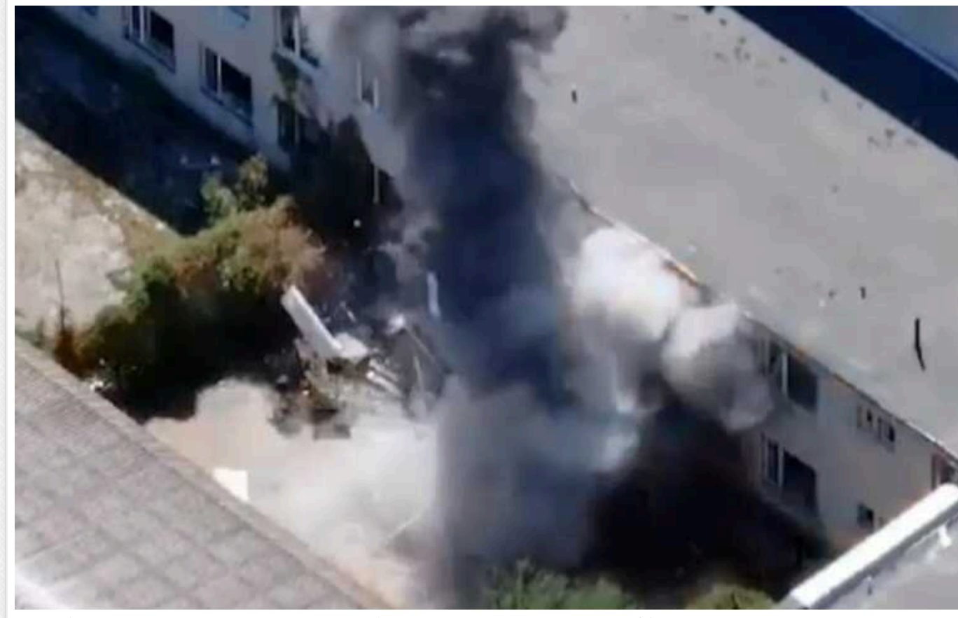
Прикордонники уразили ворожий розрахунок БПЛА: окупанти ховалися у цивільній забудові

Українські прикордонники продовжують нищити російських окупантів на полі бою. Захисники ліквідують ворожу силу за допомогою безпілотників.