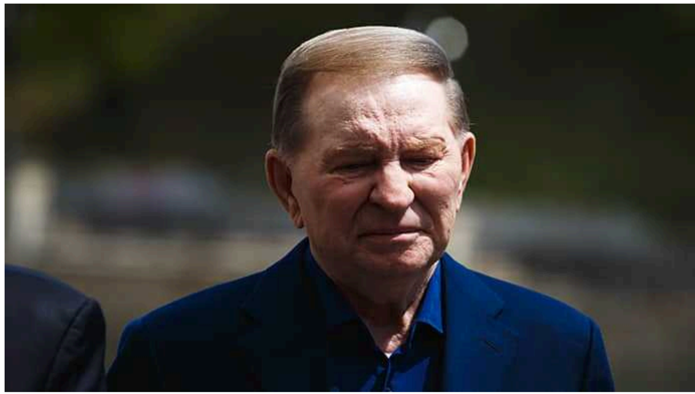
Українців обурив випуск новин про Кучму 1996 року

У мережі завірусився старий випуск новин 1996 року, де розповідали про відрядження другого президента України Леоніда Кучми. Користувачі обурилися, як в ефірі вихваляли політика, який поклав квіти до монументу в Литві.