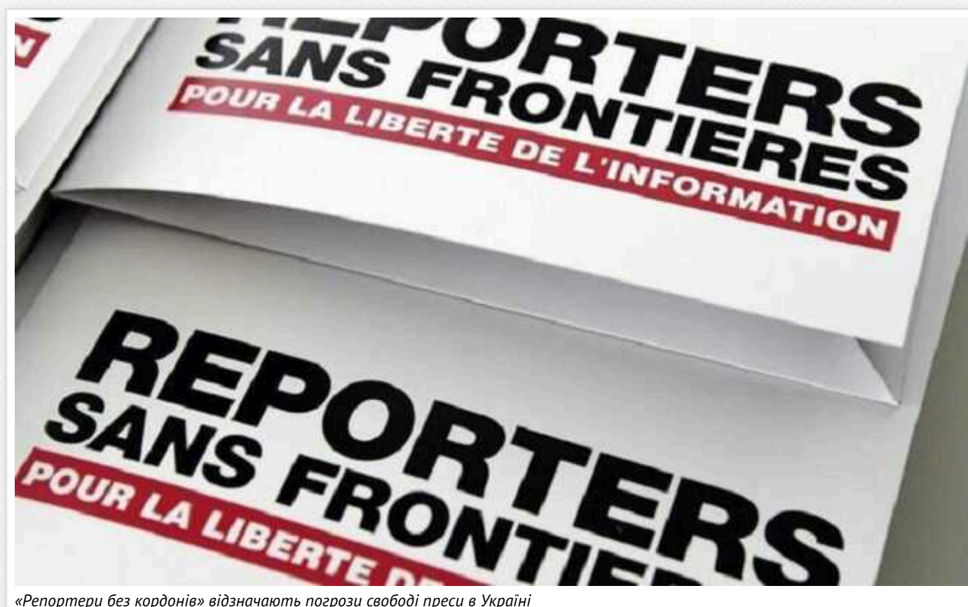
«Репортери без кордонів» відзначають погрози свободі преси в Україні

Правозахисна організація "Репортери без кордонів" заявила про "скорочення свободи преси в Україні" та "тиск на незалежні ЗМІ".