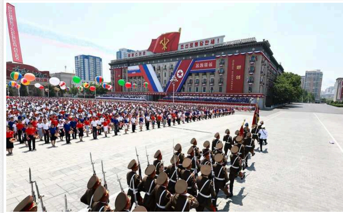
На Заході побачили у союзі Москви та Пхеньяну найсерйознішу загрозу глобальній безпеці з часів Корейської війни, – ЗМІ

Поглиблення співробітництва Росії та КНДР може створити найсерйознішу загрозу глобальній безпеці з часів Корейської війни.