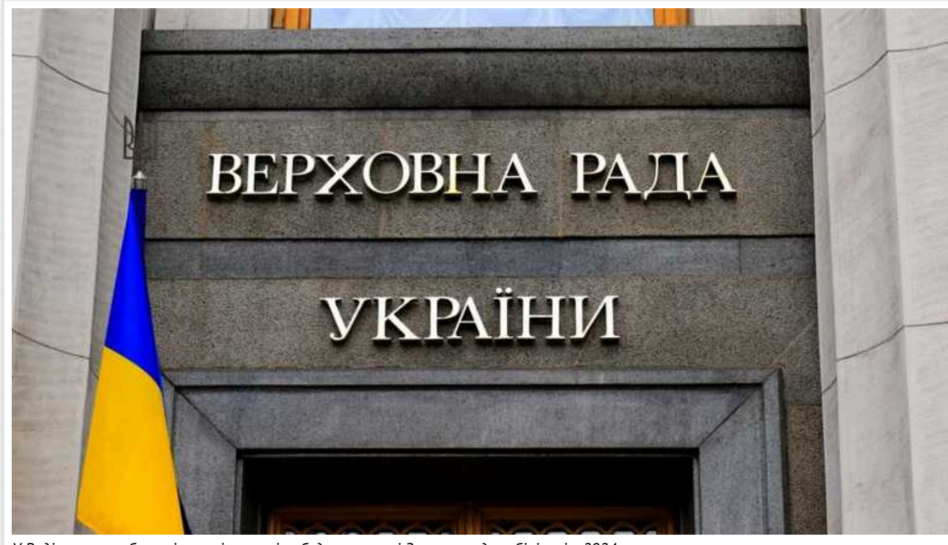
У Раді розкрили бажані терміни, в які набуде чинності Закон про демобілізацію 2024 року