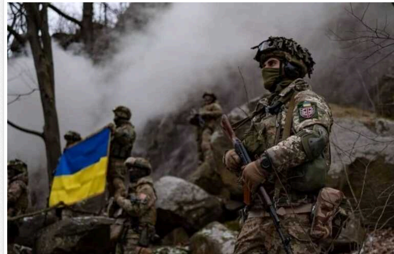
ISW: У ЗСУ є успіхи на Харківському напрямку, окупанти в оточенні на заводі у Вовчанську

Українські військовослужбовці контратакували окупантів на півночі Харківщини. ЗСУ мають успіхи в районі населеного пункту Тихе, а також в інших районах на північній схід від Харкова.