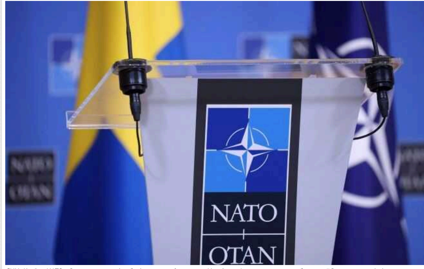
CNN: Країни НАТО обговорюють, які зобов'язання щодо вступу України в Альянс взяти на себе на майбутньому саміті

Члени Північноатлантичного альянсу дискутують щодо того, наскільки рішучим має бути формулювання рішення саміту НАТО у Вашингтоні стосовно майбутнього членства України.