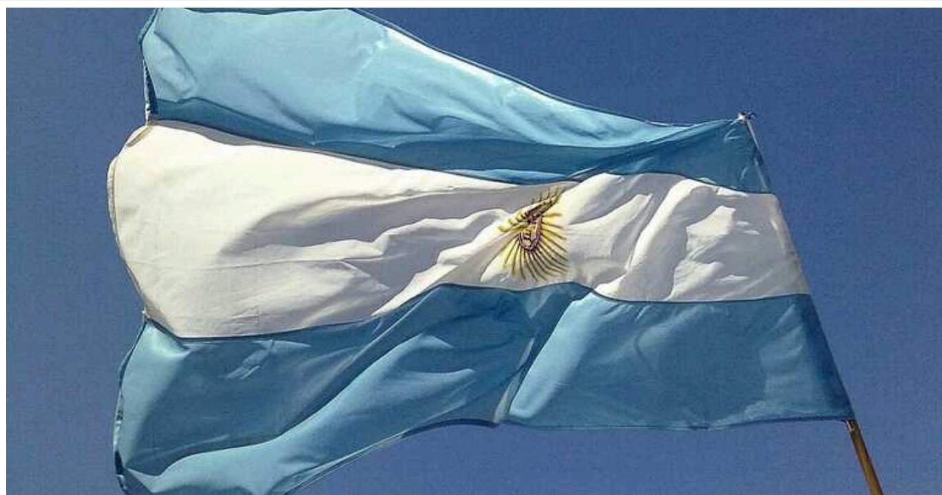
Аргентина не має наміру постачати зброю Україні

Уряд Аргентини виключив можливість відправки озброєння в Україну, але пообіцяв гуманітарну та логістичну допомогу.