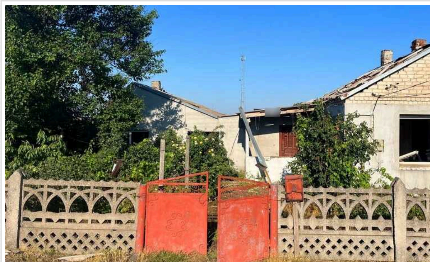
Минулої доби окупанти обстріляли 26 населених пунктів Херсонщини: 1 людина загинула

Протягом минулої доби ворог не припиняв обстрілів житлових кварталів населених пунктів Херсонщини. Є загиблий та поранені.