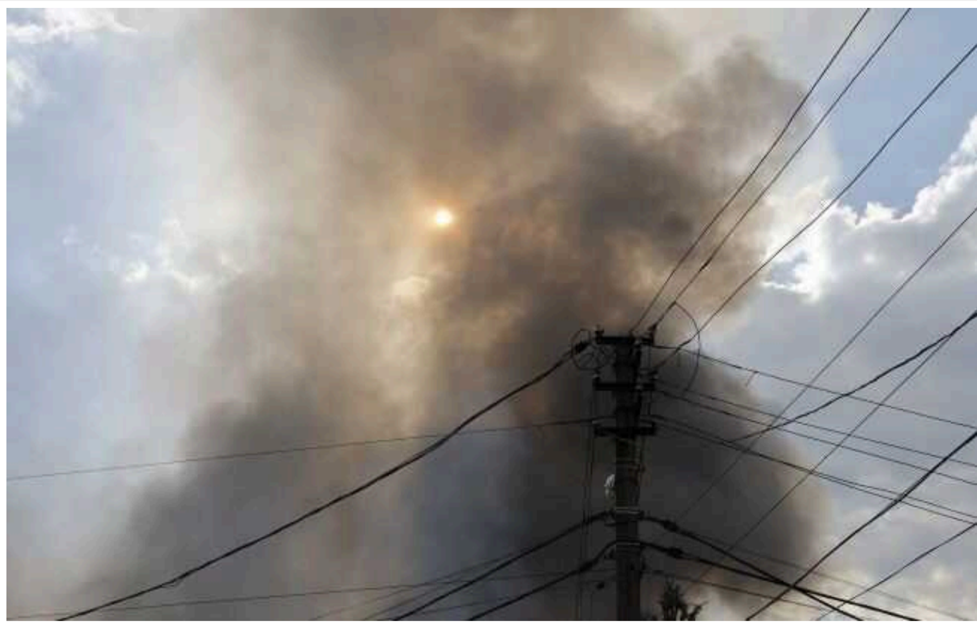
У Херсоні пролунали вибухи