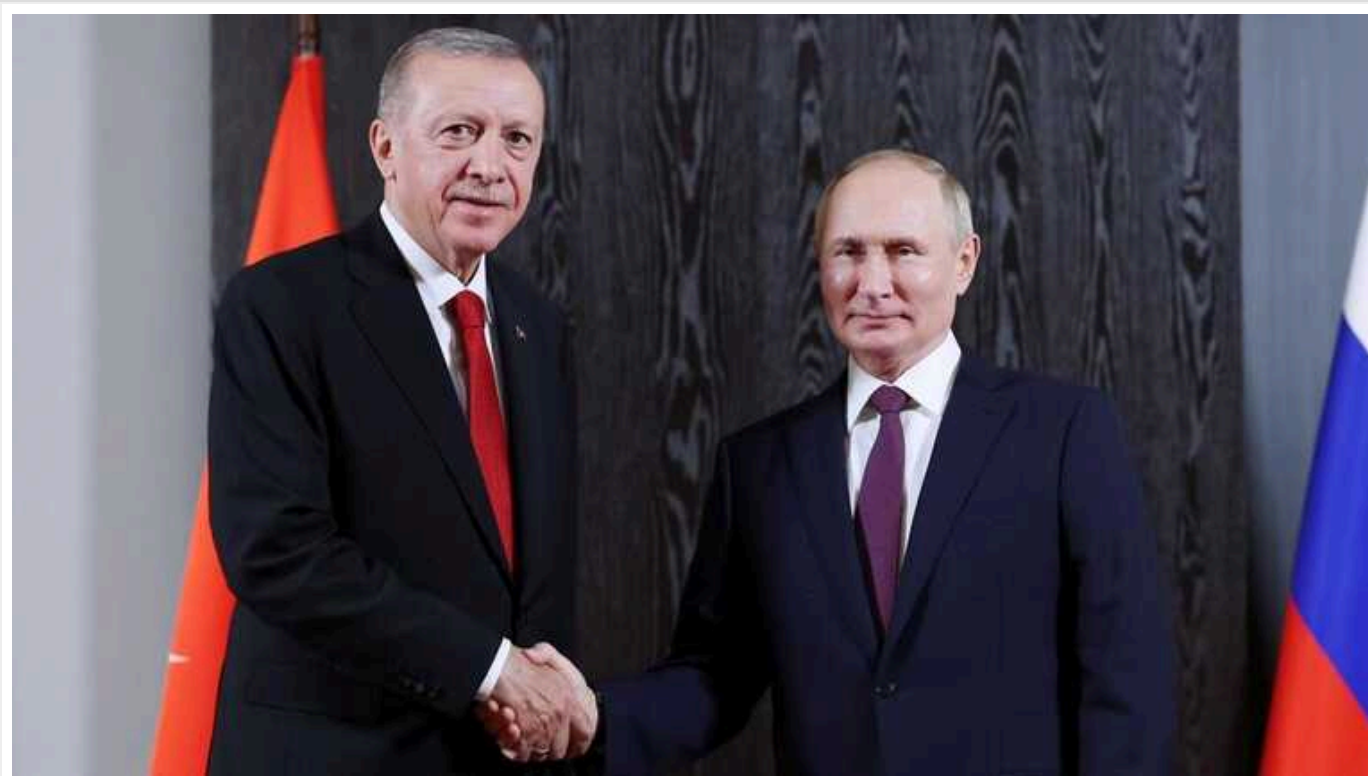
Ердоган планує провести переговори з Путіним

Президент Туреччини Реджеп Тайп Ердоган 3-4 липня візьме участь у саміті глав держав та урядів Шанхайської організації співробітництва (ШОС) в Астані, де планує провести переговори з російським диктатором Володимиром Путіним.