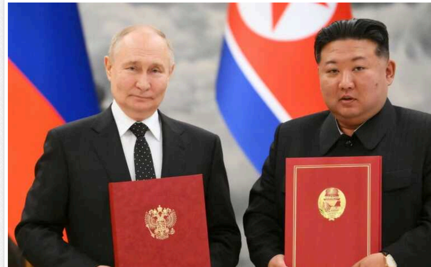
Північнокорейське державне агентство оприлюднило пункти договору між КНДР та РФ

За інформацією Корейського центрального інформаційного агентства, договір РФ та КНДР про всеосяжне стратегічне партнерство передбачає "негайне" надання взаємної допомоги у разі агресії проти однієї з країн.