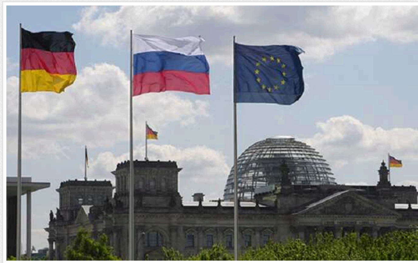
Reuters: Німеччина знову перешкоджає ухваленню нового пакету санкцій ЄС проти РФ

Країни Європейського Союзу не змогли погодити 14-й пакет санкцій проти Росії, оскільки Німеччина заблокувала його ухвалення.