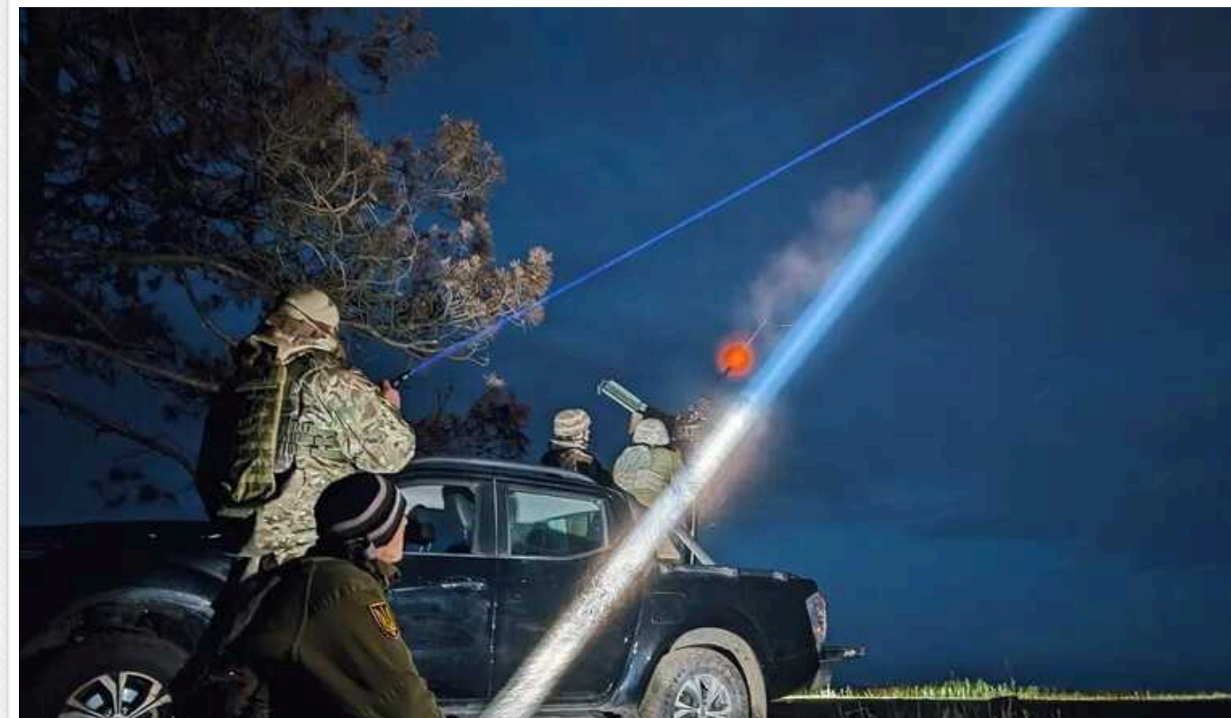
Сили ППО збили п'ять ракет і 27 дронів-камікадзе, якими РФ атакувала Україну

Сили протиповітряної оборони України вночі 20 червня відбили масовану російську атаку, яку країна-агресор здійснила 36 засобами нападу. У небі над низкою регіонів захисники збили п'ять ракет і 27 дронів-камікадзе типу Shahed-131/136 .