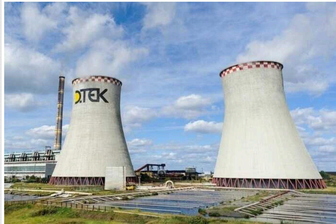
РФ атакувала теплоелектростанцію ДТЕК: є постраждалі

У ніч на 20 червня окупаційна армія РФ завдала чергового удару по теплоелектростанції ДТЕК. Внаслідок обстрілу поранення отримали троє працівників об'єкта критичної інфраструктури.