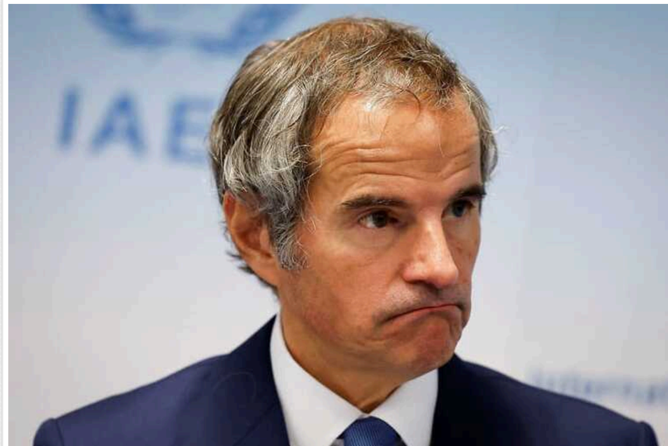
Незважаючи на обмежений доступ, МАГАТЕ володіє ситуацією на ЗАЕС, – Гроссі

МАГАТЕ володіє ситуацією на Запорізькій АЕС, незважаючи на обмежений доступ, який надають російські окупанти.