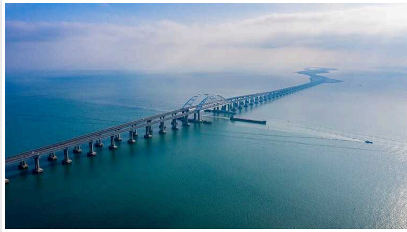
Окупанти збільшили кількість захисних барж біля Кримського мосту

Російські окупанти продовжують посилювати захист Кримського мосту від атак українських морських дронів. Кількість захисних барж біля нього збільшилася у півтора раза, а під самою переправою також з'явилися конструкції, схожі на пірси.