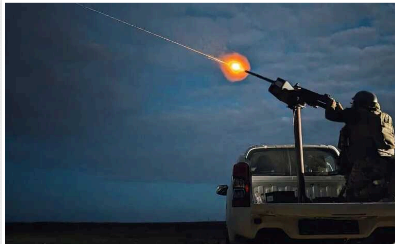
Атака «шахедів» на Київ: ППО знищила всі цілі, попередньо, руйнувань немає

Силами та засобами протиповітряної оборони всі ворожі ударні дрони були знищені на підступах до столиці. На даний момент у Києві не зафіксовано ні руйнувань, ні постраждалих.