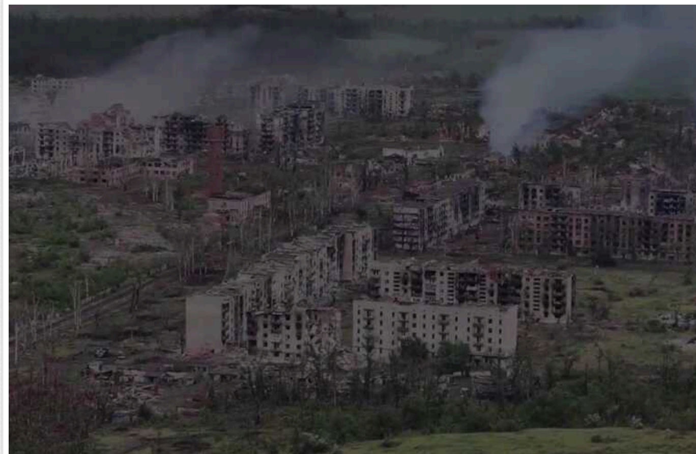
Військові з 225 ОШБ опублікували відео зруйнованого міста Часів Яр

Відео фронтового Часового Яру Донецької області.