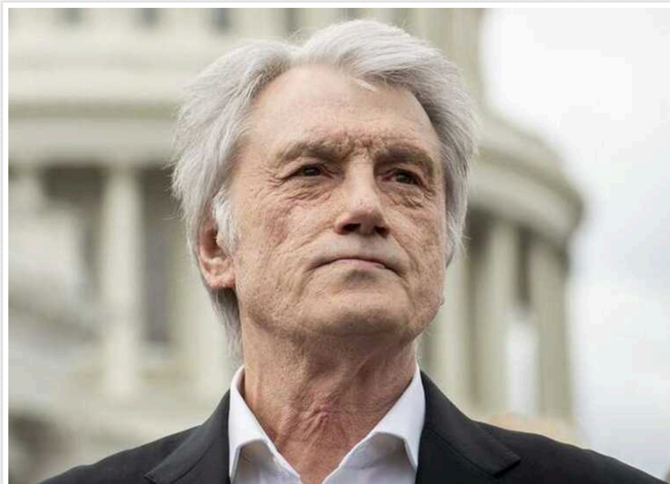
Ющенко завдяки потиличнику став зіркою TikTok

У соціальній мережі TikTok поширення набирає відео, у якому одну з головних ролей зіграв третій Президент України Віктор Ющенко.