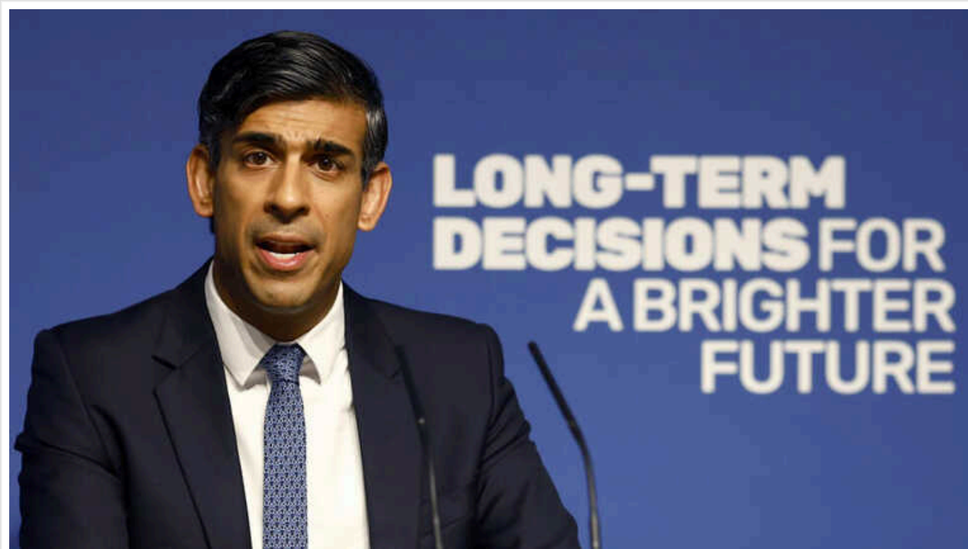
Консервативну партію британського прем'єра Сунака чекає поразка на загальних виборах у країні

Як пише Bloomberg, свідчать результати трьох великих опитувань, проведених у середу.