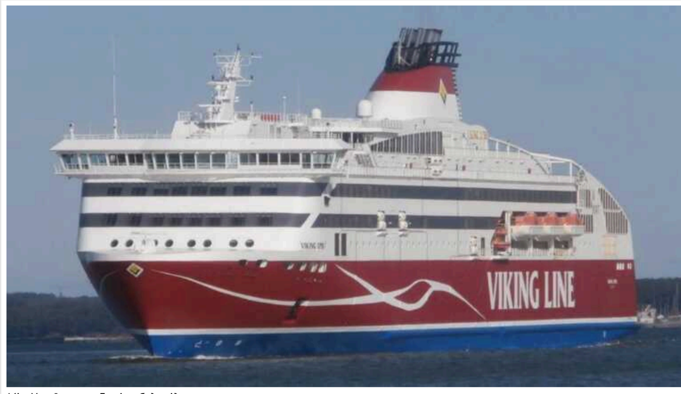
Між Україною та Грузією буде відновлено поромне сполучення