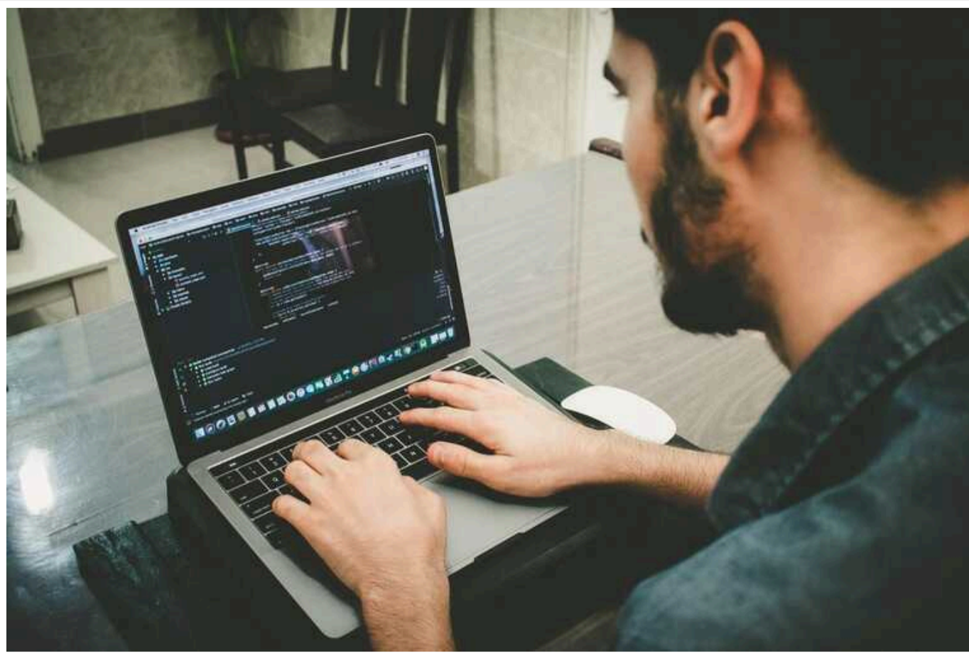
Україну за 2023 рік залишили від 8 до 15 тисяч ІТ-фахівців

Про це свідчать дані IT Research Resilience, наведені у спільному дослідженні Мінцифри, AI HOUSE та Roosh.