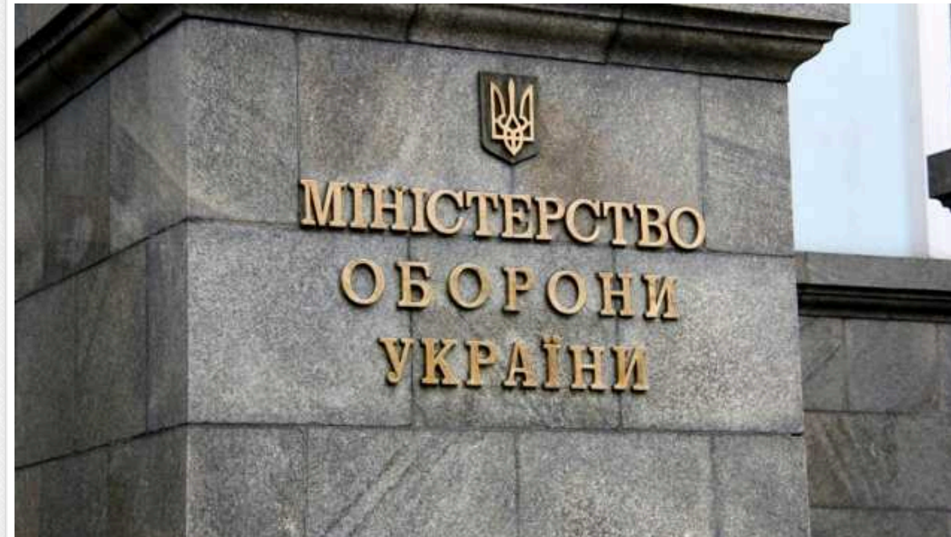
Українці, яких зняли з військового обліку через виїзд за кордон, мали повторно стати на нього до 18 червня, — Міноборони

Громадянам, які не стали на облік до 18 червня, загрожує штраф від 17.000 гривень до 25.500 гривень.