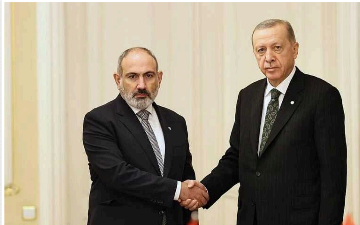
Туреччина та Вірменія готові до врегулювання двосторонніх відносин