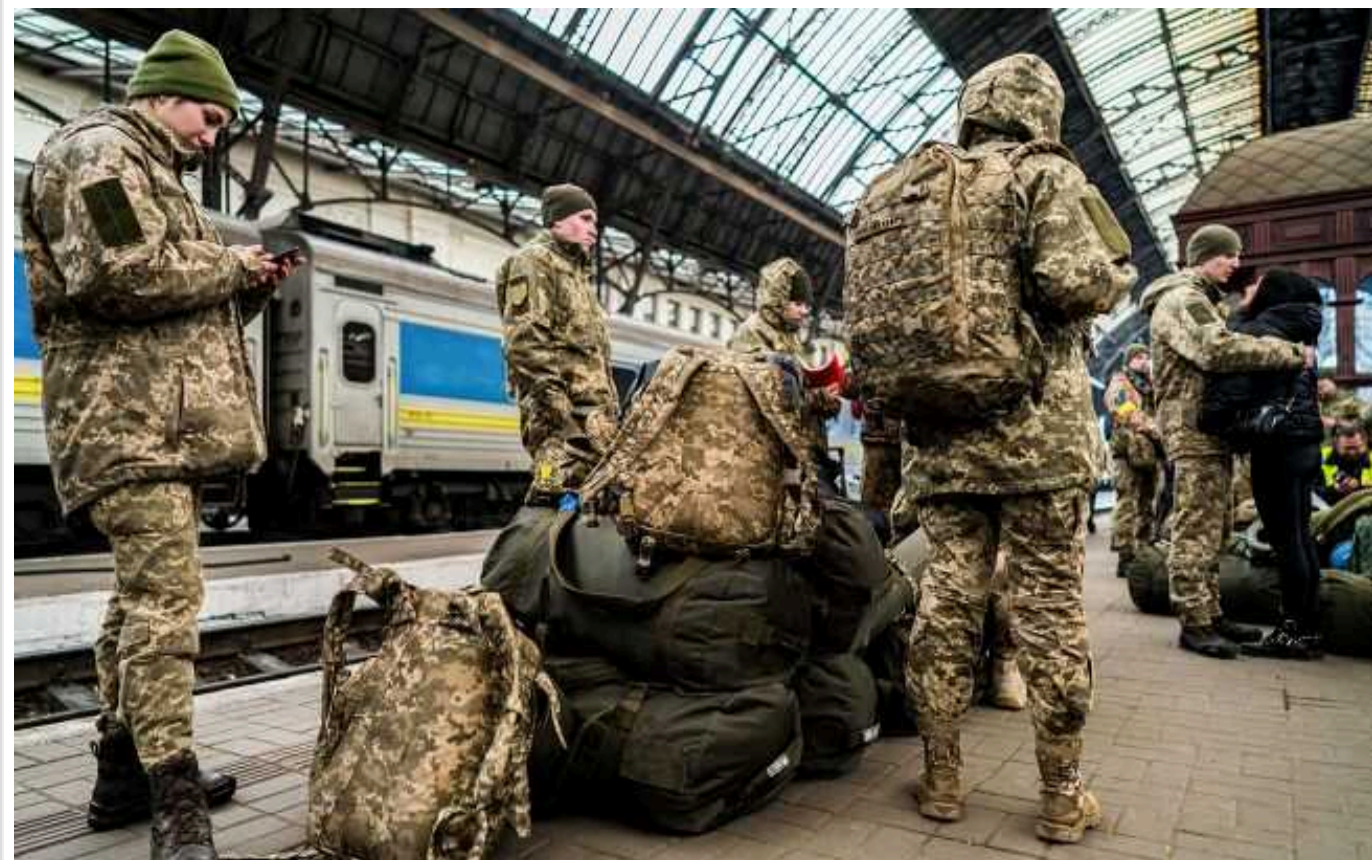
У МО відповіли на головні питання про ТЦК і повістки

Після того, як в Україні набрав чинності новий закон про мобілізацію, у військовозобов'язаних виникла низка питань щодо його дії.