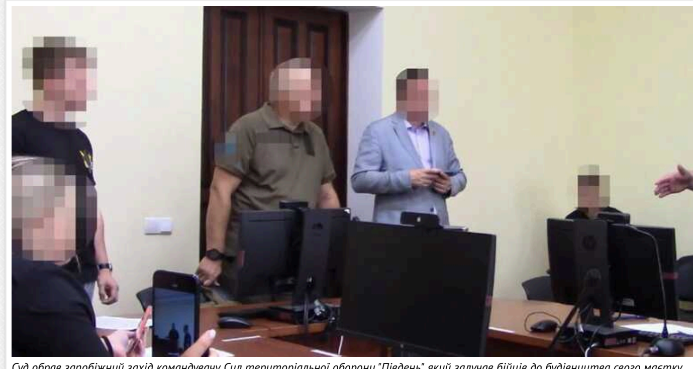
Суд обрав запобіжний захід командувачу Сил територіальної оборони "Південь", який залучав бійців до будівництва свого маєтку

Командувачу регіонального управління Сил територіальної оборони "Південь", який змушував підлеглих будувати йому приватний будинок, обрано запобіжний захід. Підозрюваному потрібно внести 2 млн гривень застави.