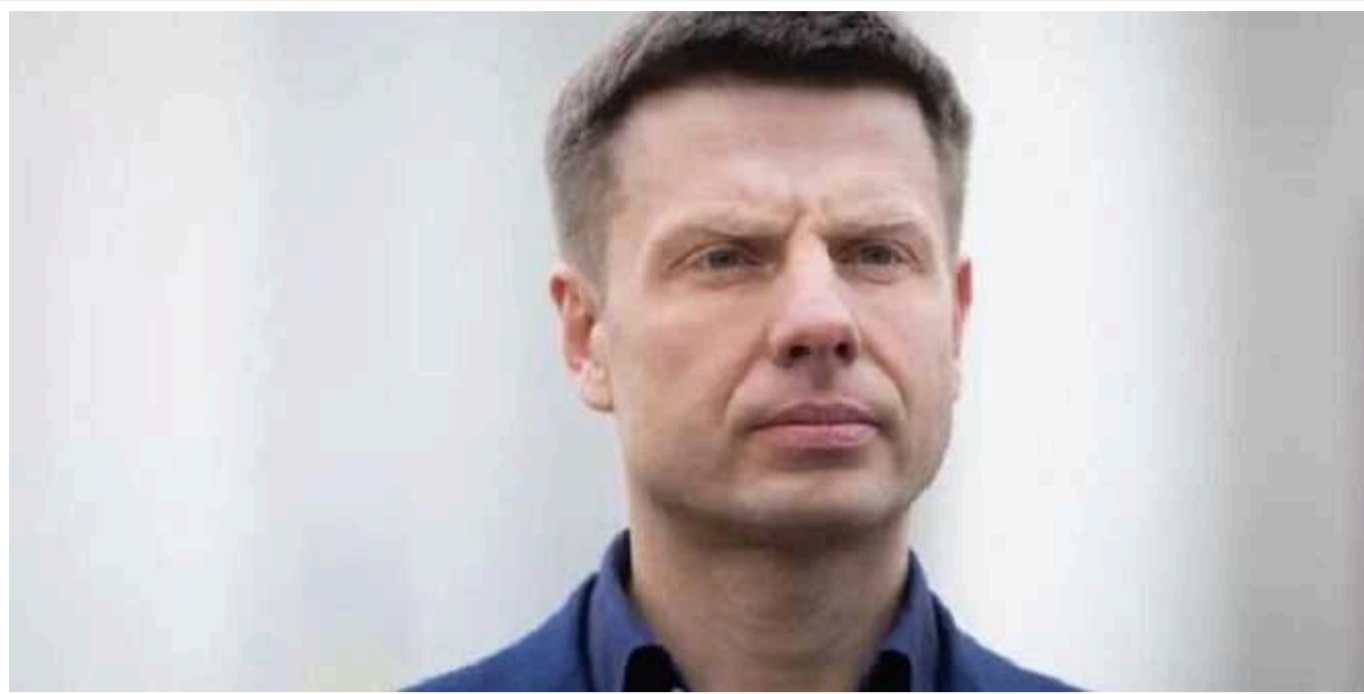
3 трибуни Верховної Ради Гончаренко послав Путіна «на х@й»

3 трибуни Верховної Ради народний депутат Олексій Гончаренко послав «на х@й» Путіна.