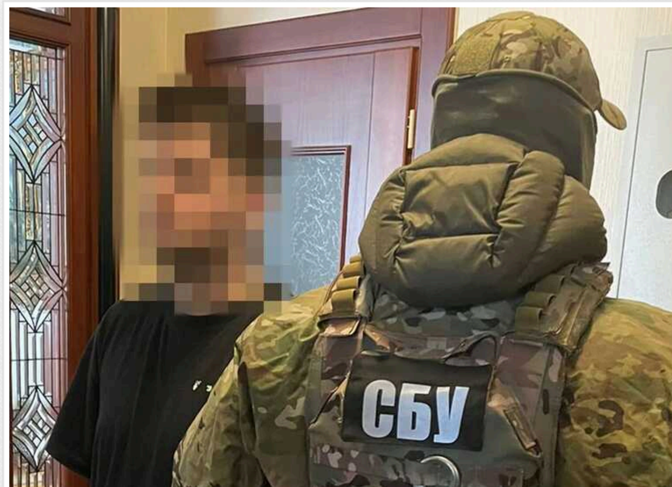
Правоохоронці повідомили про підозру мешканцю Києва, який вигукував гасла кадировців на вечірці

За матеріалами СБУ підозру отримав молодик з Києва, який виклав у мережу відео з гаслами кадировців. Вирішувється питання щодо обрання йому запобіжного заходу.