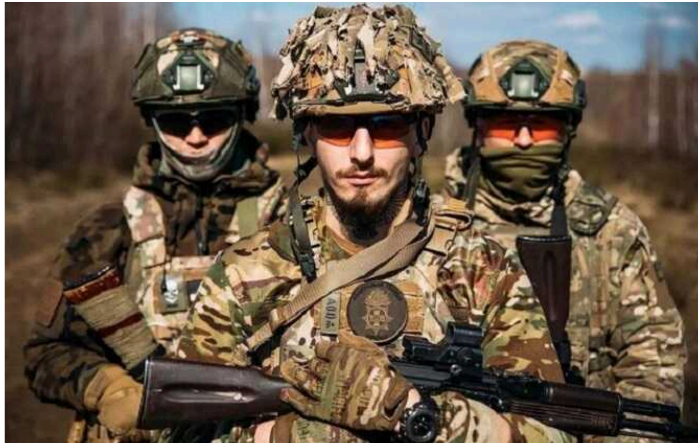
У НГУ розповіли, що відбувається на Лиманському напрямку