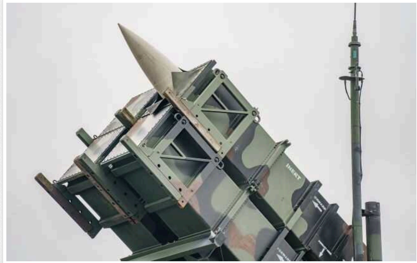
США відмовили Швейцарії у постачанні ракет для Patriot через Україну

За даними швейцарських журналістів, відповідно до договорів із Вашингтоном, зміна узгоджених умов допускається за наявності виняткових підстав, пов'язаних із національною безпекою США. У цій ситуації Білий дім заявляє, що повномасштабні бої в Україні є такою підставою.