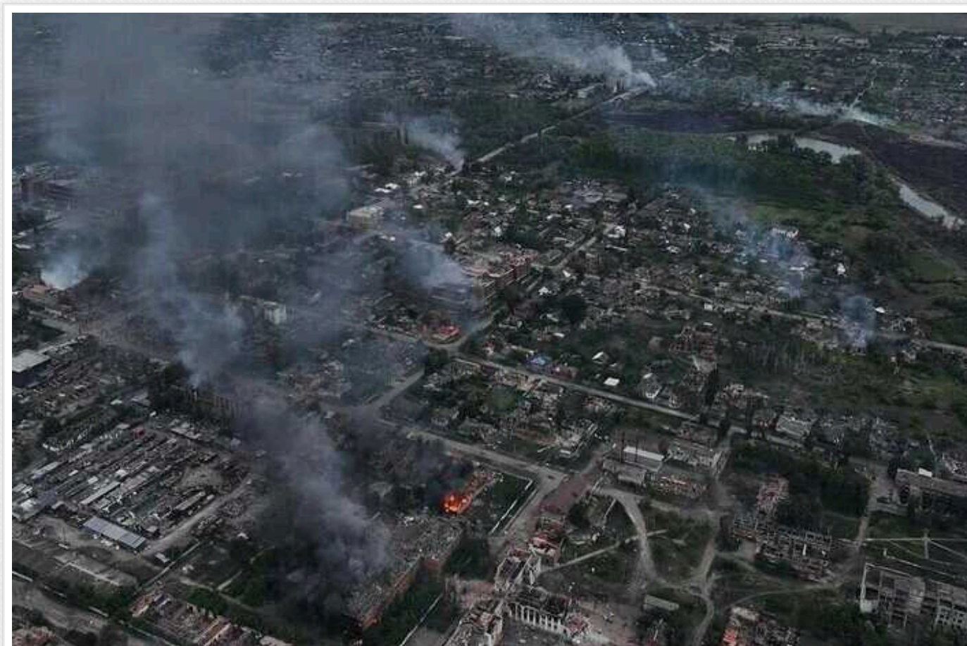
У Вовчанську бої йдуть за кожну вулицю і будинок, – ОВА