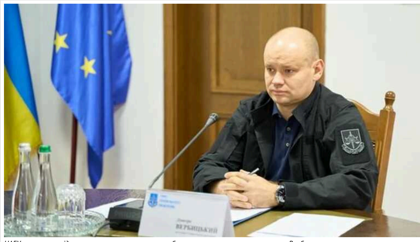
НАБУ почало розслідування можливого незаконного збагачення заступника генпрокурора Вербицького

Національне антикорупційне бюро розпочало провадження за фактом можливого незаконного збагачення заступника генпрокурора Дмитра Вербицького, який фігурує в журналістському розслідуванні програми «Схеми».