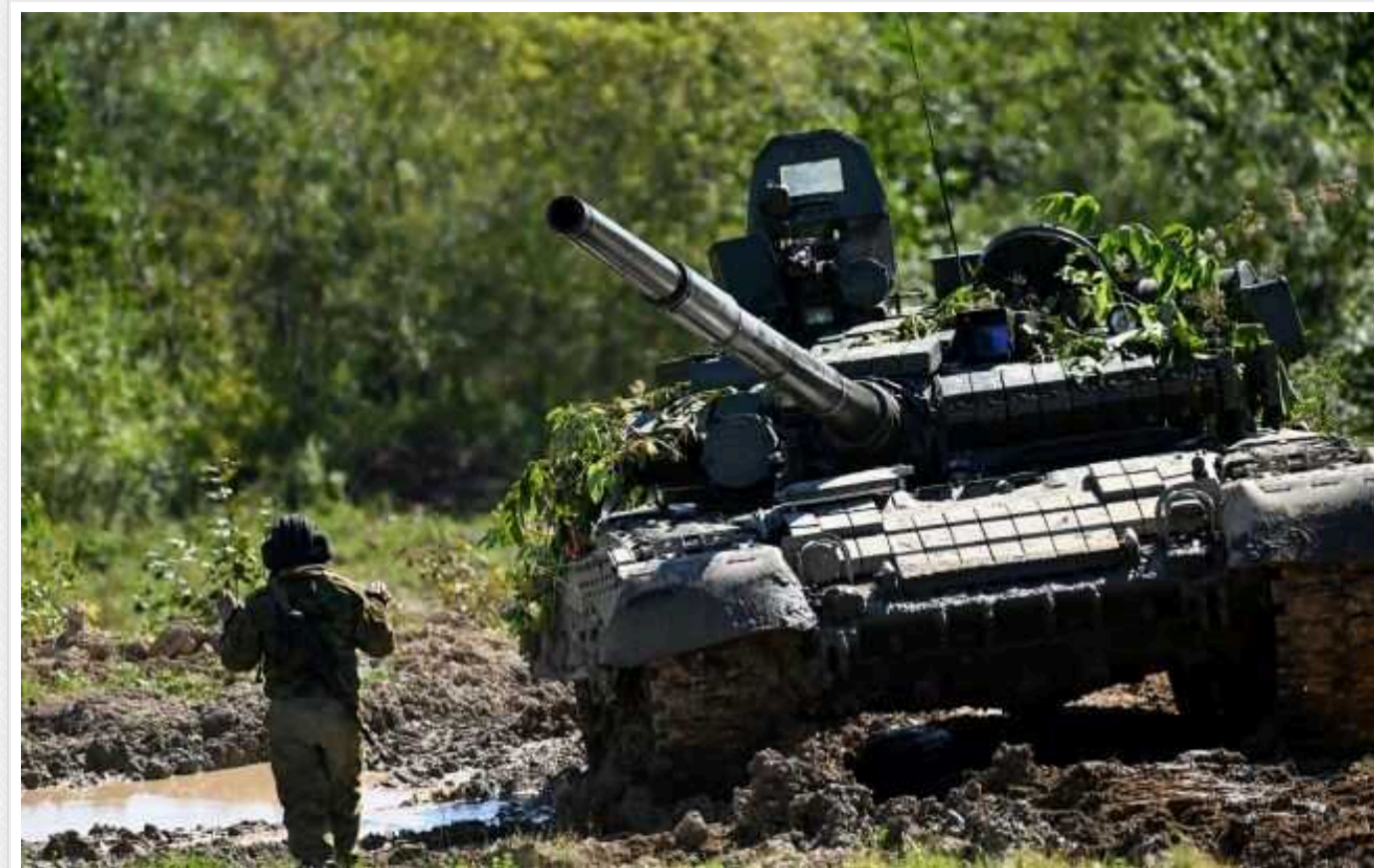
ЗСУ вдарили по Агрегатному заводі у Вовчанську, який зайняли окупанти

Українські Telegram-канали публікують кадри ударів ЗСУ по Агрегатному заводу у Вовчанську, який зайнятий військами РФ.