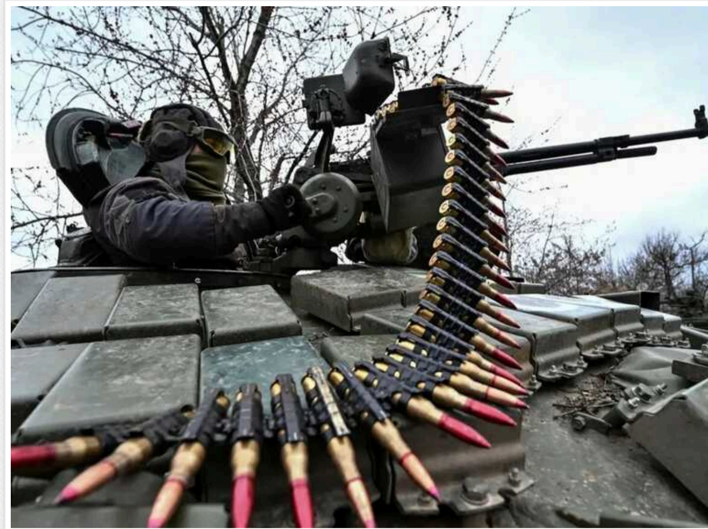
У мережі показали, як ворожа БМП підірвалась разом із десантом на броні на Лиманському напрямку

Бійці 23-го окремого стрілецького батальйону спільно з артилеристами та розвідниками 63-ої окремої механізованої бригади підірвали ворожу БМП разом із десантом на броні на Лиманському напрямку фронту.