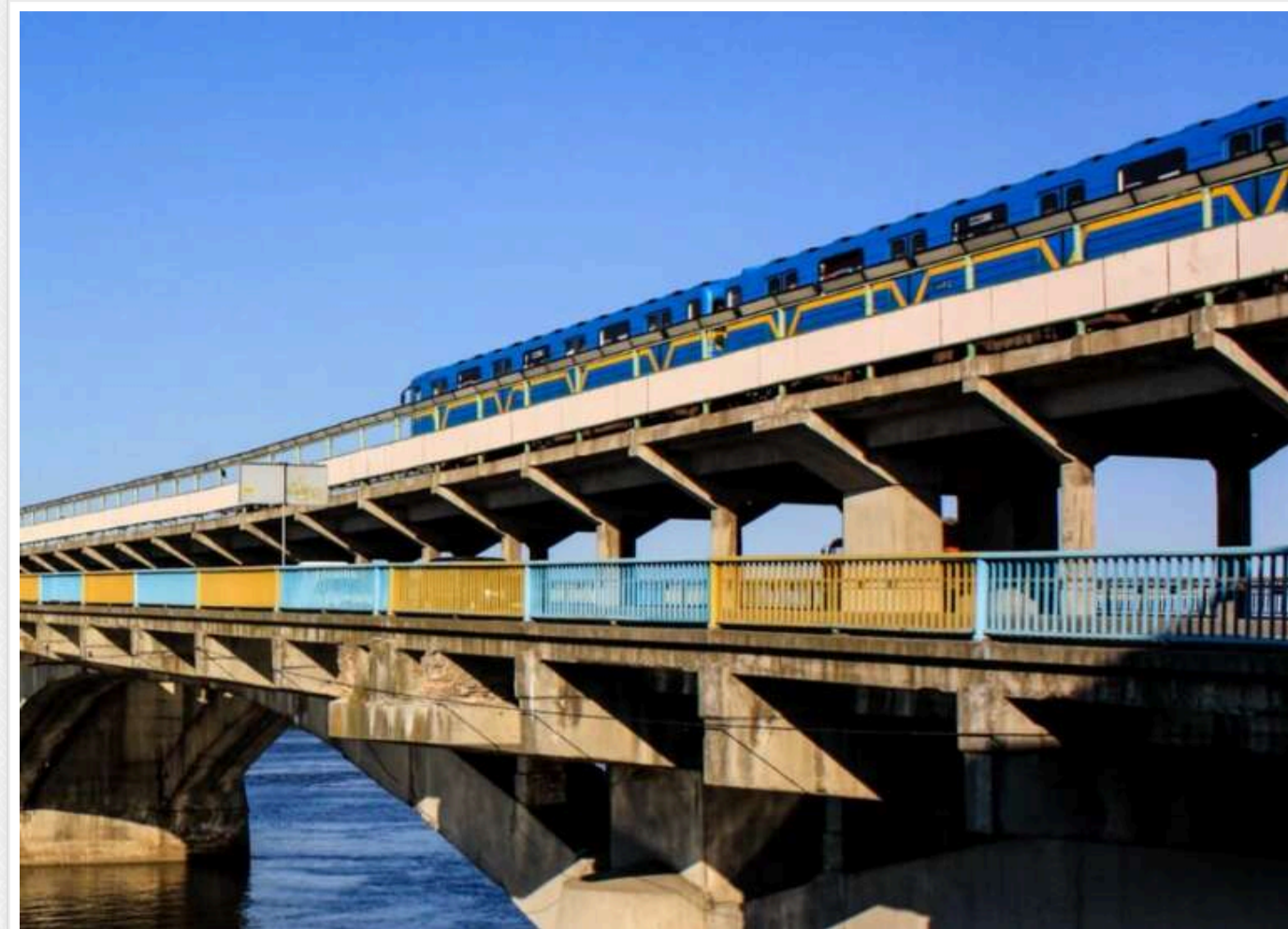
Компанія зі скандальною репутацією "Онур" буде займатися ремонтом мосту Метро в Києві

Єдиним учасником масштабного тендеру на реставрацію автопроїздів мосту Метро стала турецька компанія "Онур". Підрядник готовий виконати ремонтні дороги за 1 мільярд 995 мільйонів гривень.