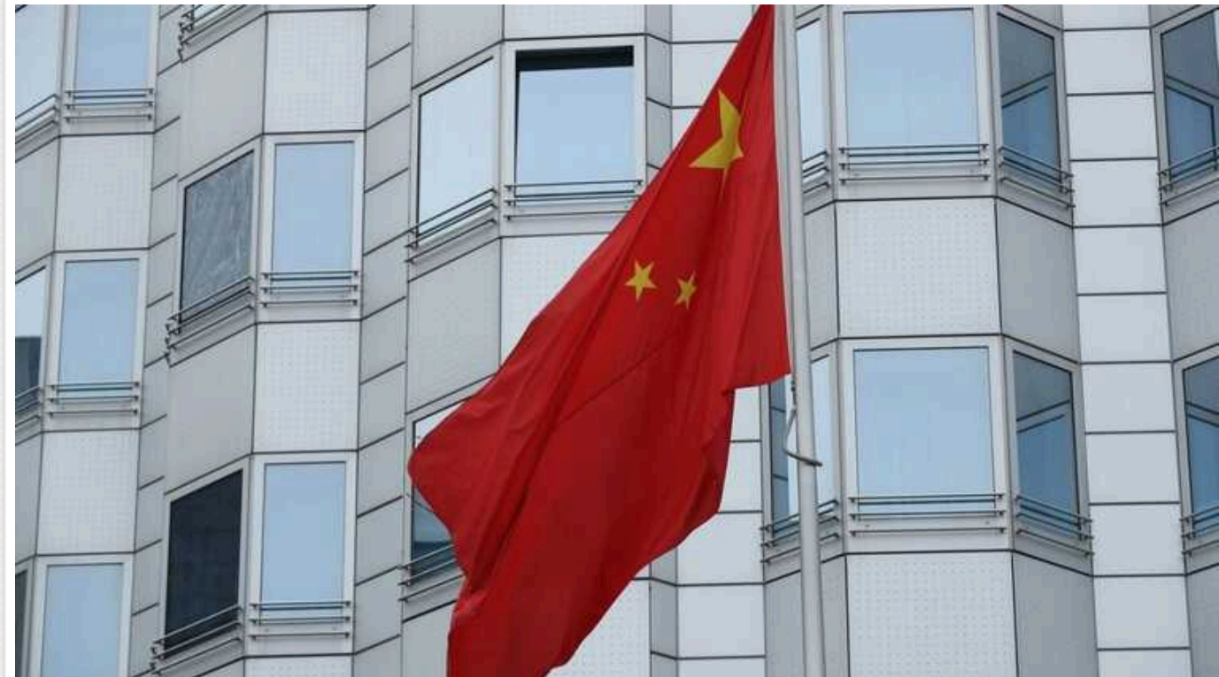
У КНР відповіли генсеку НАТО на звинувачення у розпалюванні війни проти України

Китай у вівторок закликав НАТО "припинити перекладати провину" за війну в Україні після того, як генсек Альянсу Єнс Столтенберг звинуватив Пекін у розпалюванні війни через підтримку Росії.