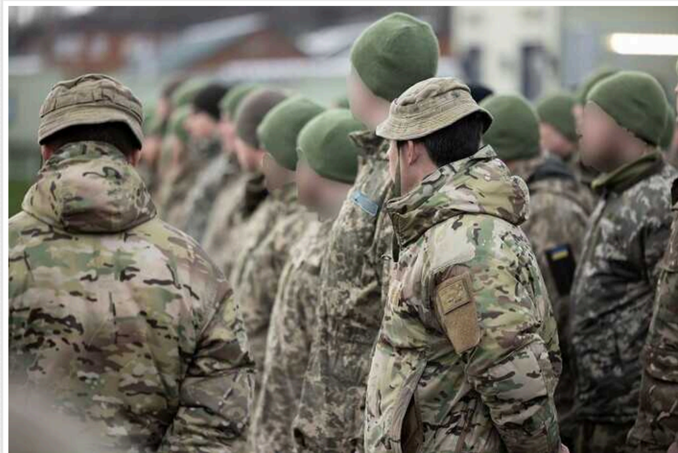
Особа, яка вручає повістку, зобов'язана буде пред'явити на вимогу громадянина службове посвідчення, – Кабмін