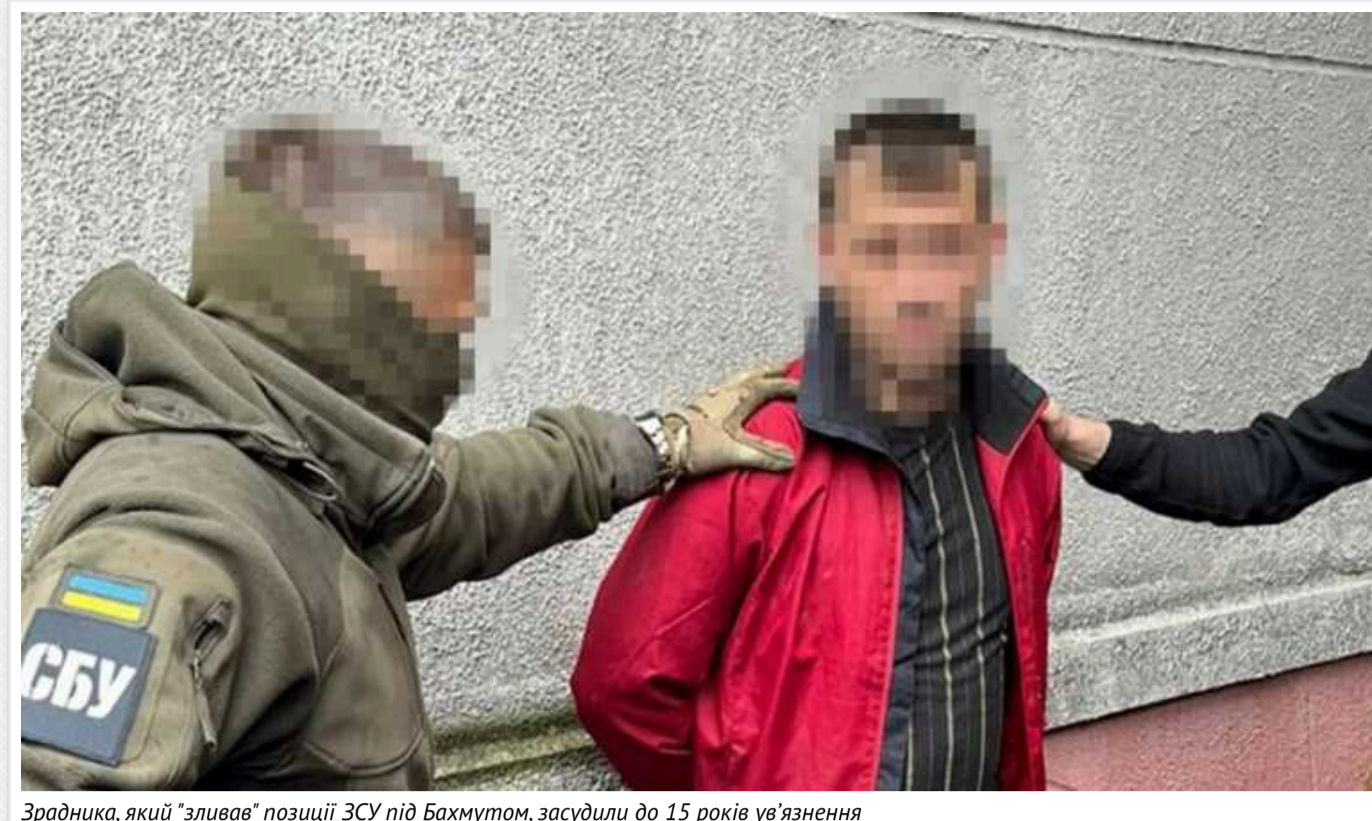
Зрадника, який "зливав" позиції ЗСУ під Бахмутом, засудили до 15 років ув'язнення

Реальний тюремний термін тримає зрадник, який передавав росіянам позиції Сил оборони України під Бахмутом. Житель Костянтинівки Донецької області проведе 15 років у в'язниці.