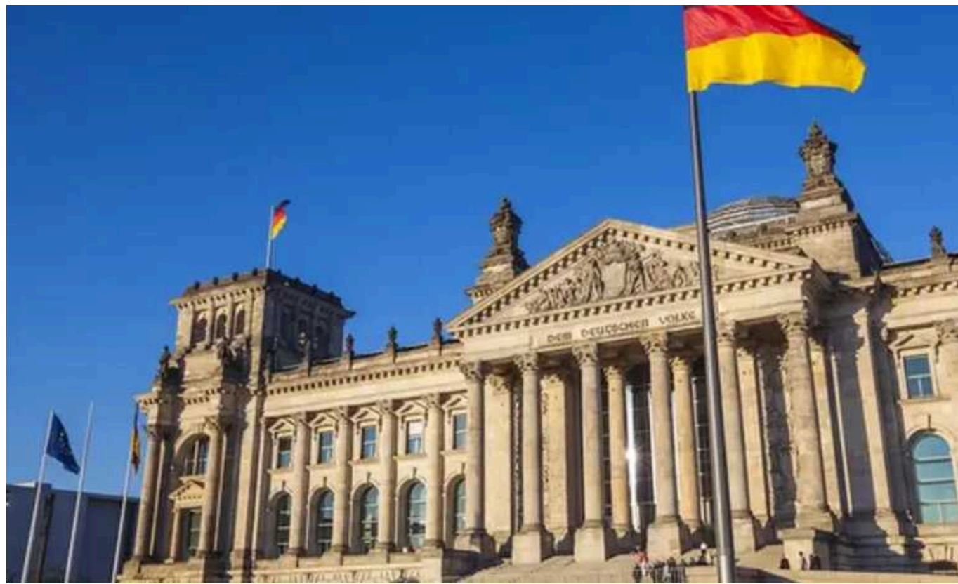
Bloomberg: В Німеччині створюють спецпідрозділ для боротьби з російською дезінформацією

У Німеччині буде створено спеціальний підрозділ, спрямований на протидію дезінформаційним кампаніям, включаючи ті, що мають російське походження. Цей підрозділ спочатку складатиметься з 10 спеціальних аналітиків, а пізніше планується збільшення кількості працівників до 20 осіб, які будуть займатися моніторингом та аналізом.