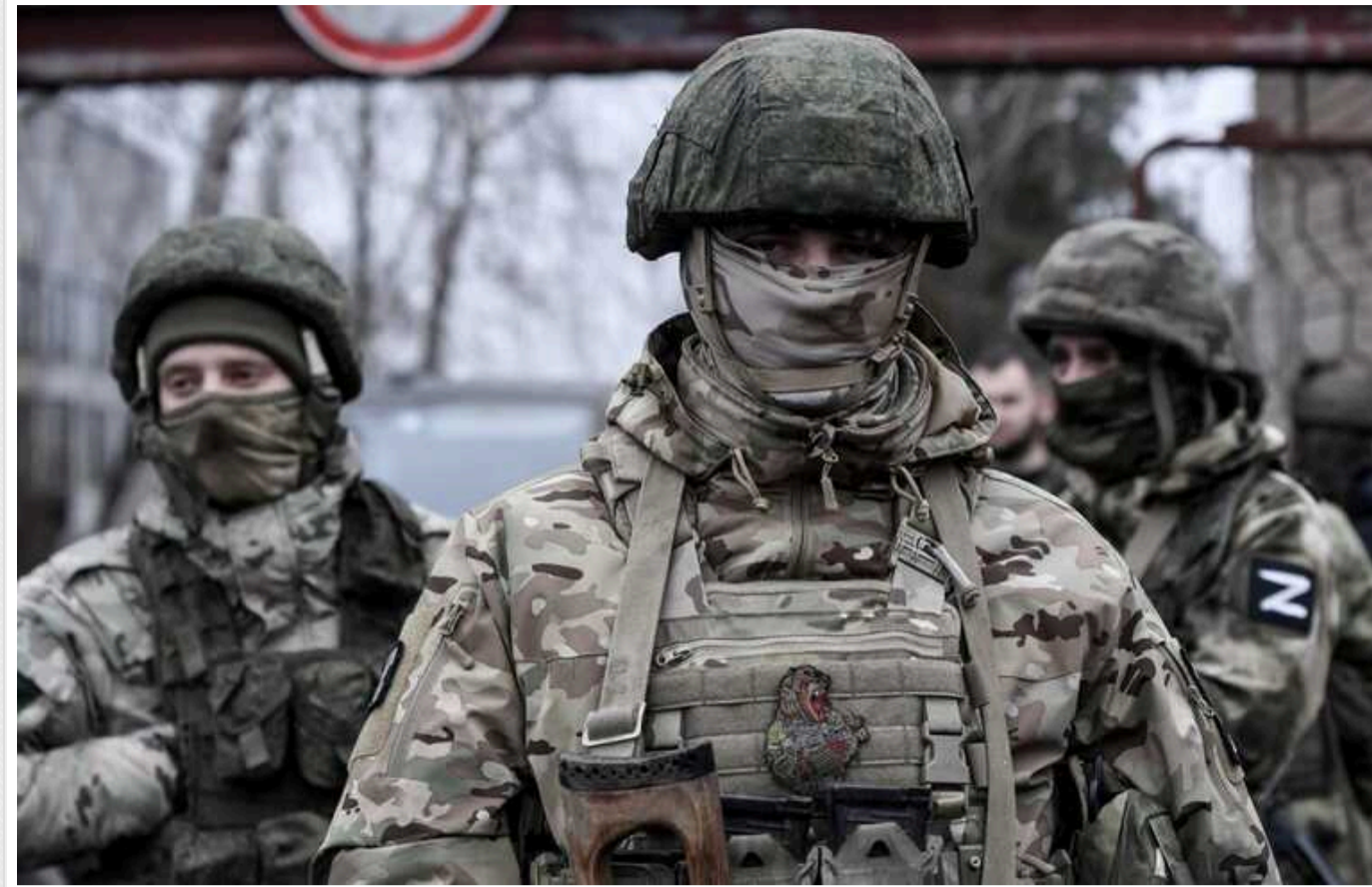
Окупанти обезголовили українського захисника в Донецькій області

Російські окупанти жорстоко вбили українського воїна в Донецькій області. Вони його обезголовили.