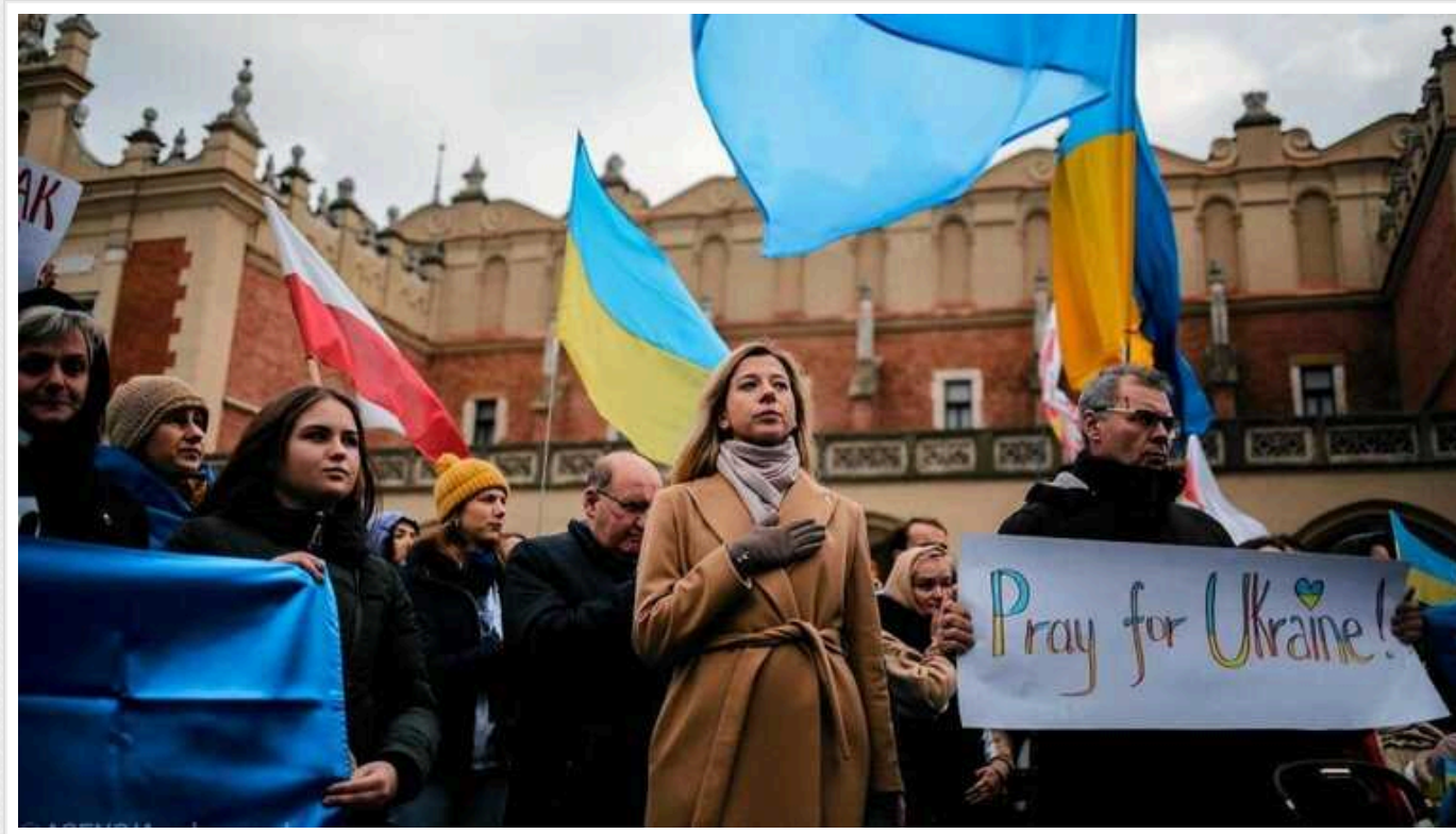
У Польщі погіршується ставлення до біженців з України