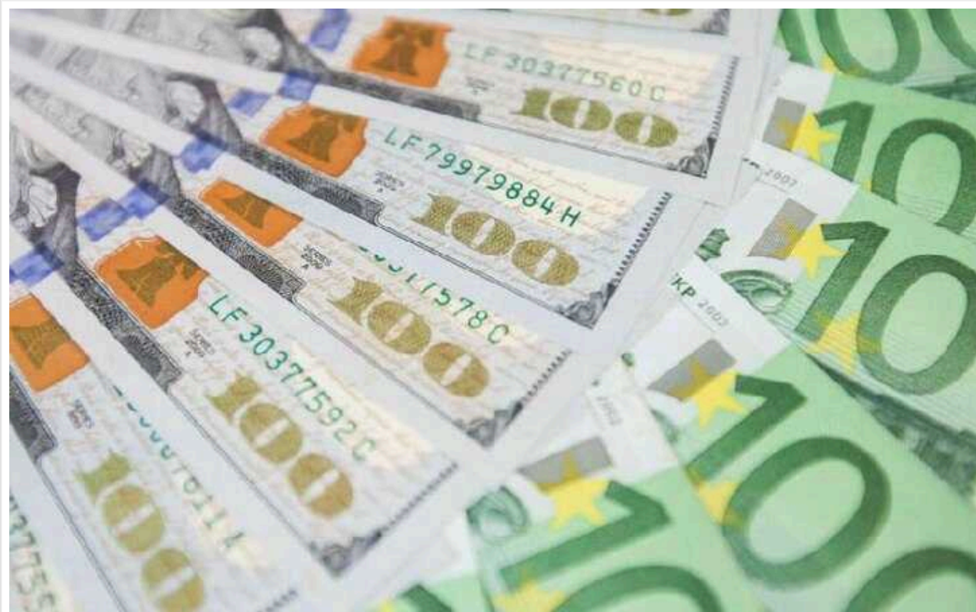
Україна отримає майже 400 мільйонів доларів на допомогу біженцям та ВПО, а також додаткову допомогу на відновлення енергетики

Україна отримає від партнерів додаткову допомогу на відновлення енергетики та гуманітарні цілі. Зокрема, США нададуть 1,5 млрд доларів, які будуть направлені через USAID і Державний департамент.